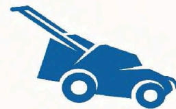
Údržba venkovních ploch