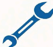
Údržba a revize