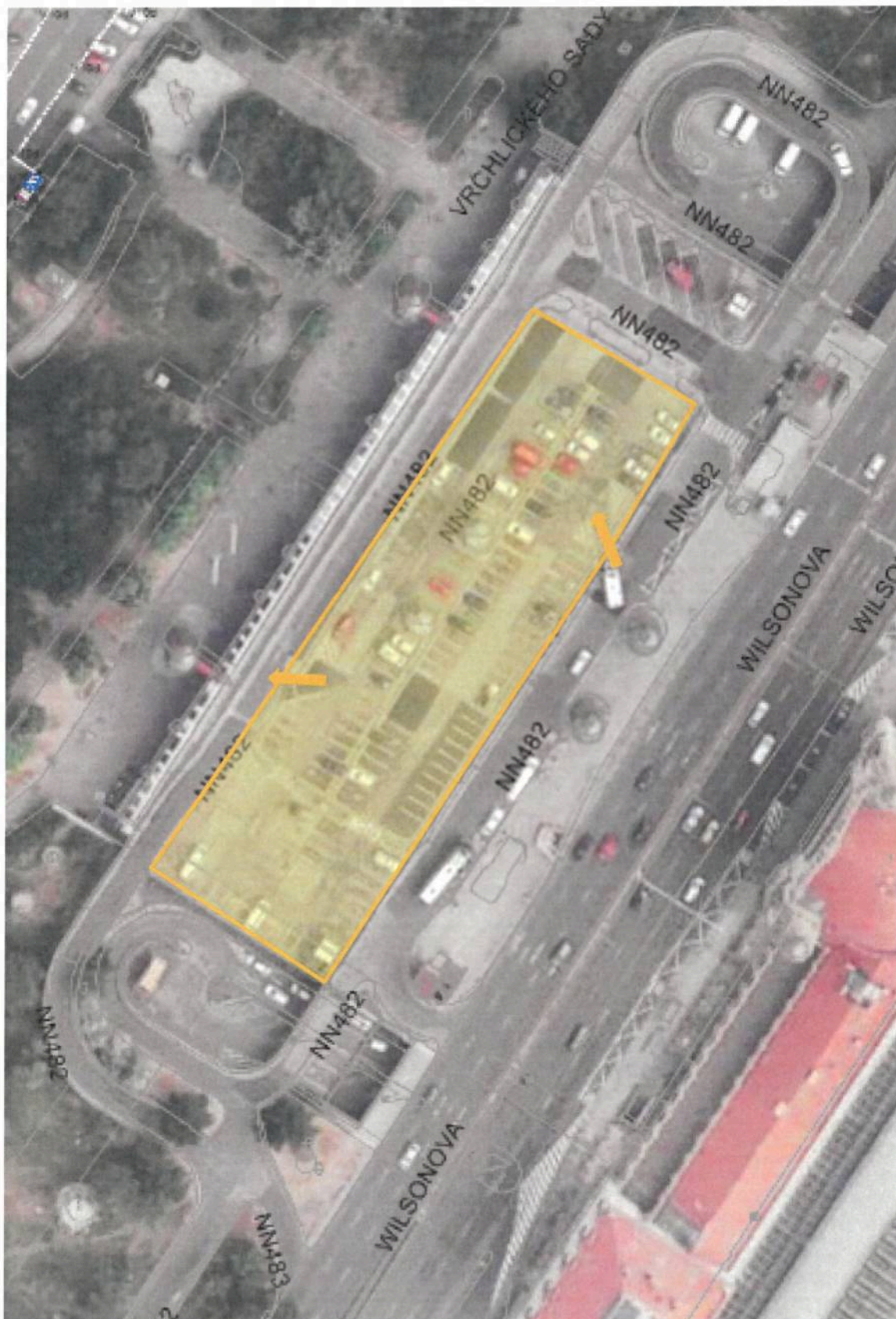
Příloha č. 1) Terasa – část objektu GPKW