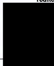
Václav Šeffl Obchodní zástupce