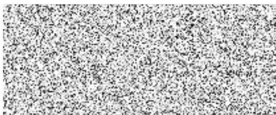
Plavecká škola Jihlava s. r. o. (dodavatel)