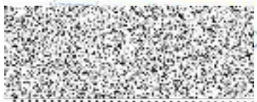
Pozemkový fond ČR vedoucí územního pracoviště Plzeň - jih Ing. Olga Štruncová