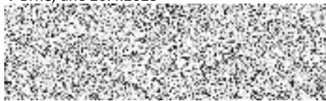
RICOH Czech Republic s.r.o. zhotovitel