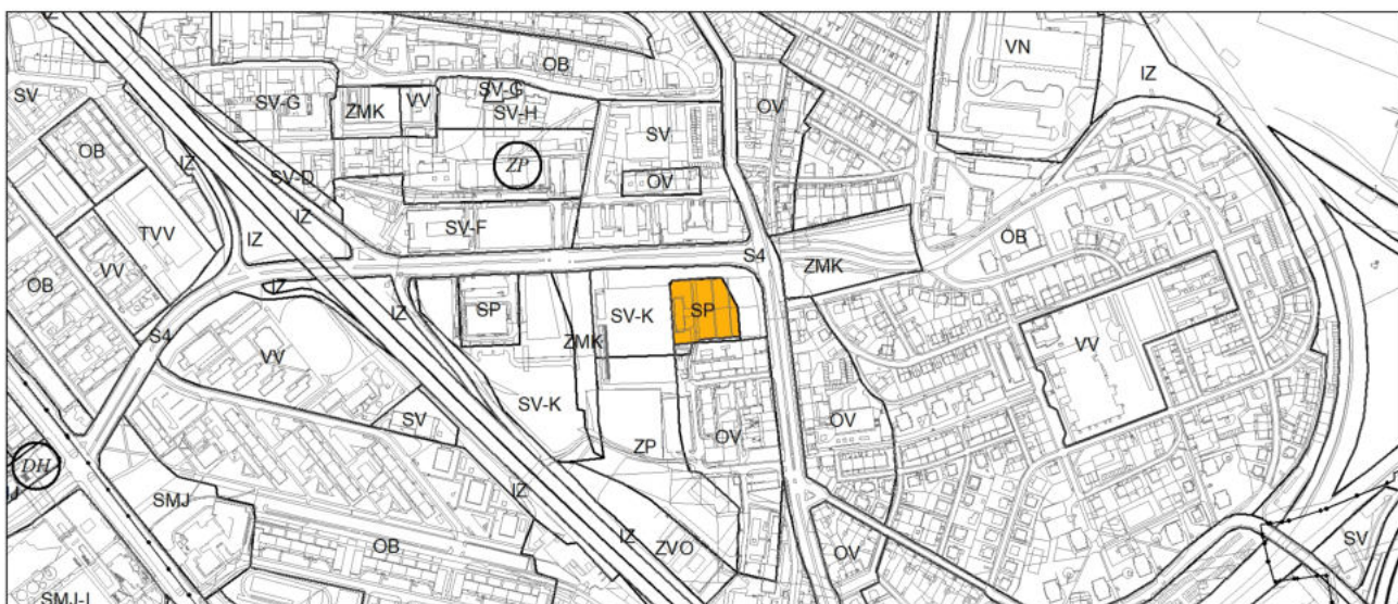
Zákes zadání změny schválený usnesením ZHMP č. 12/16 ze dne 12. 12. 2019