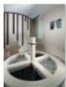
34 VOLAREZA Bedřichov Kneippův chodník.jpg