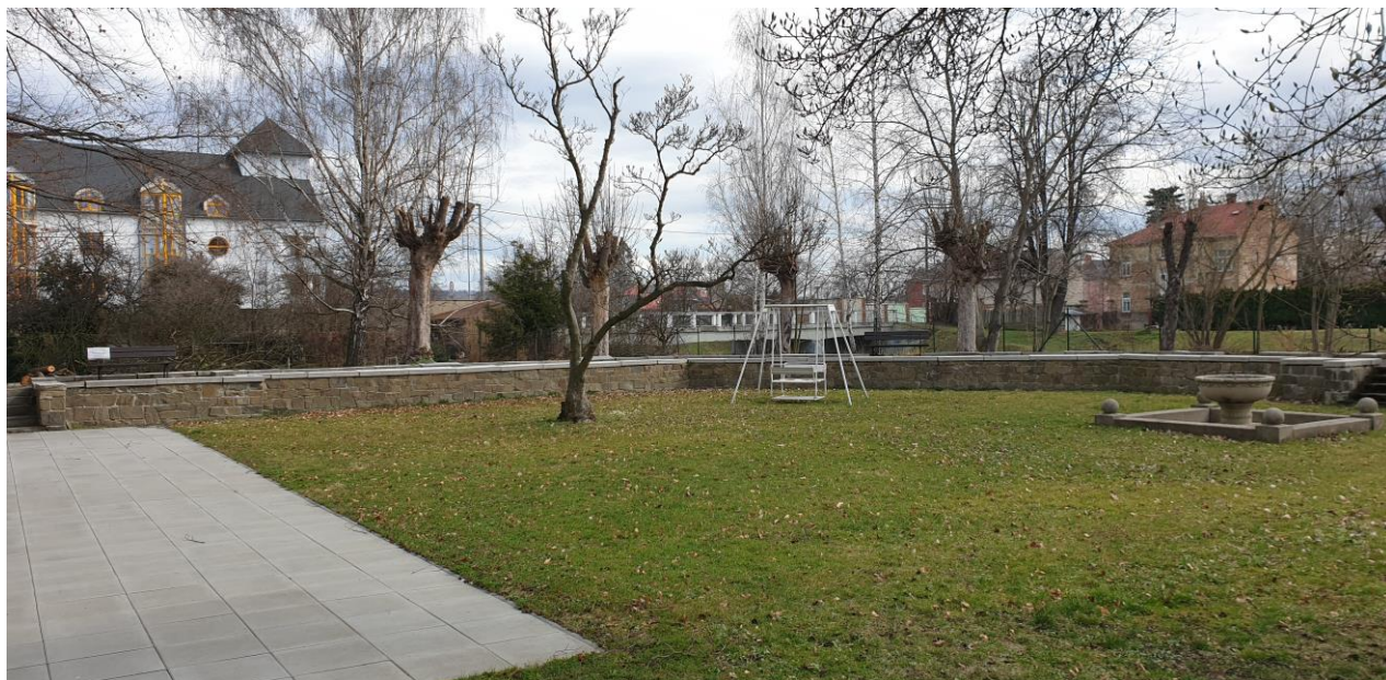
▲ levá část ochozu při pohledu od vily