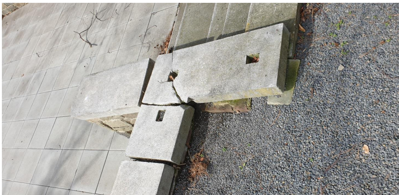
▲ prasklá krycí deska / opětovně složit do původního stavu