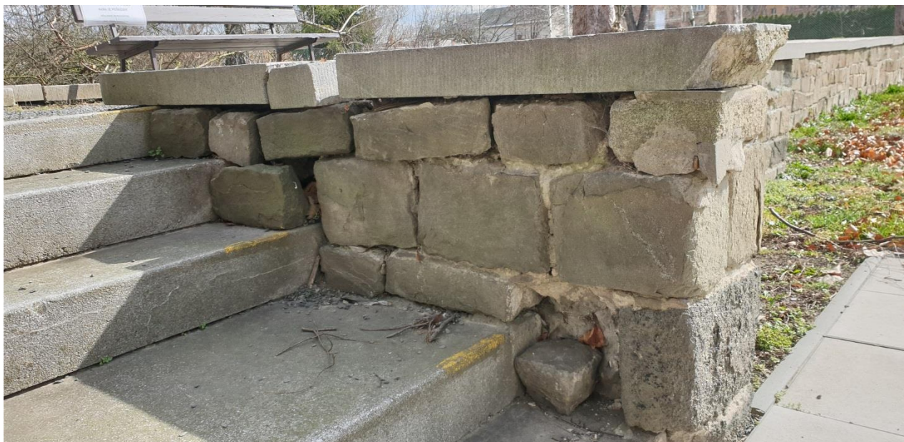
▲ část zdiva určeného k přezdění a k dozdivce