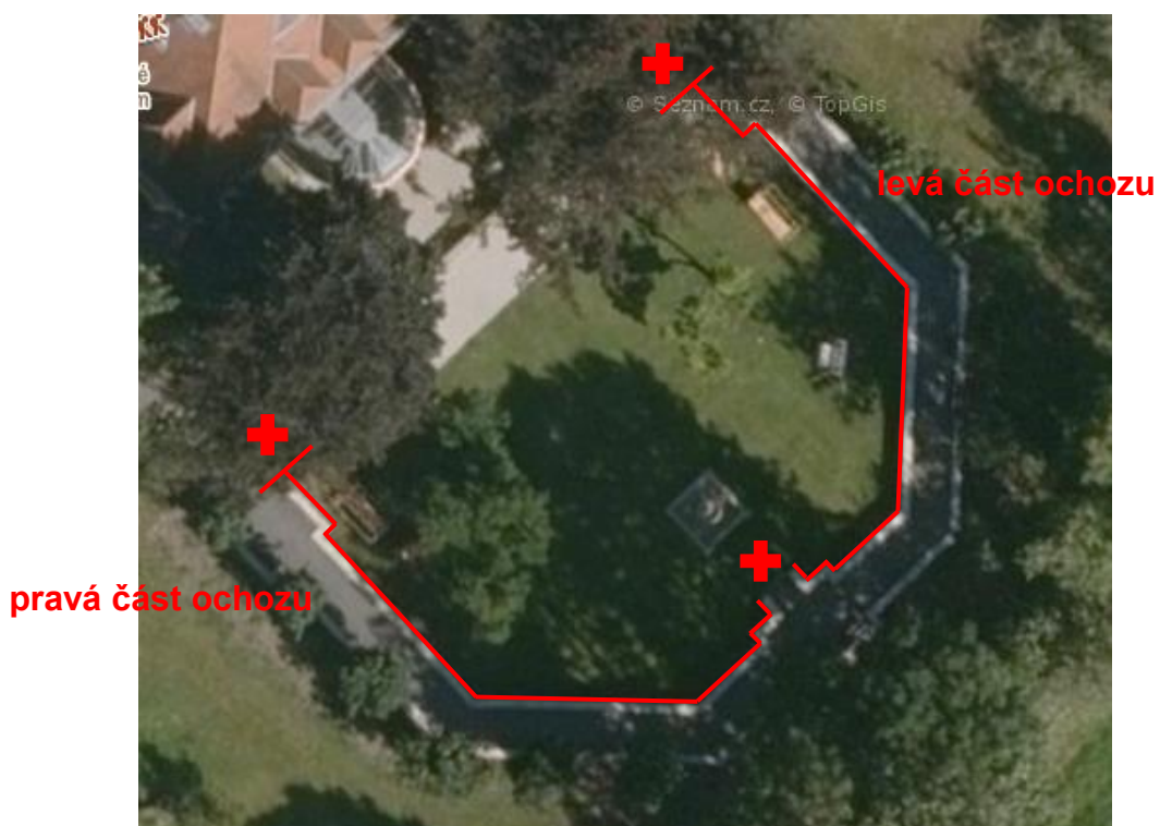
▲ -- rozsah oprav / + terénní schodiště