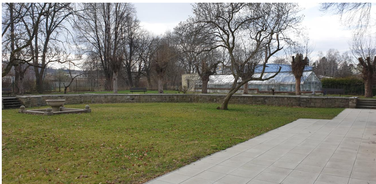
▲ pravá část ochozu při pohledu od vily