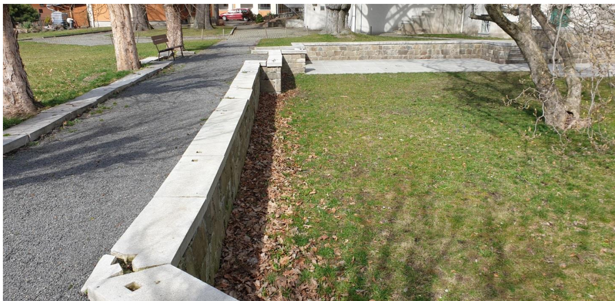
▲ ohoz / přístup na ohoz od vjezdové brány