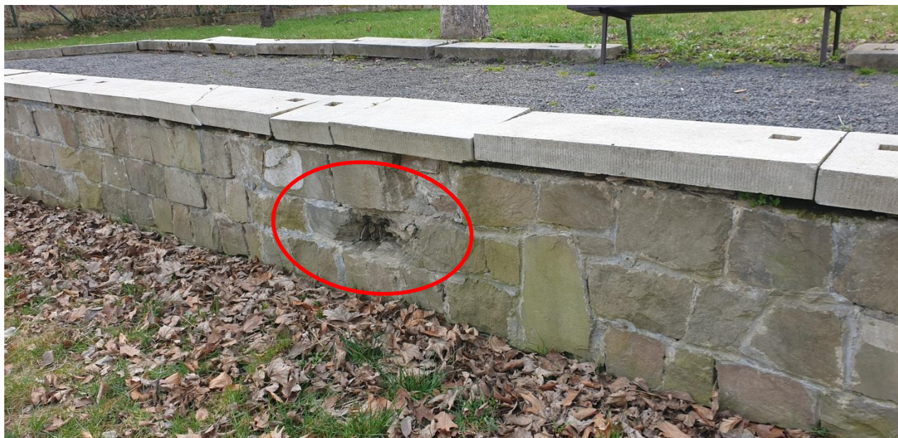
▲ prasklé desky / dozívka zdiva zdícími kameny