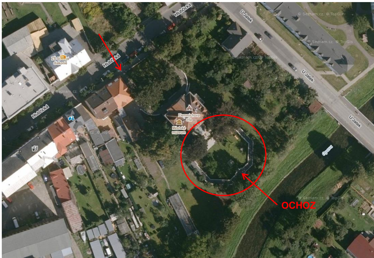
▲ přehledná mapa / vjezd do zahrady