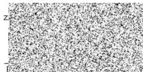
jednatel společnosti Bohemia Trade & Investments s. r. o