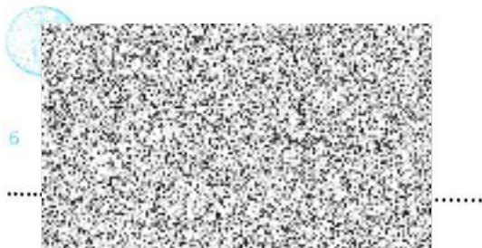
WOMEN FOR WOMEN, o.p.s. dárce