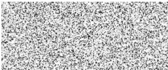
WOMEN FOR WOMEN, o.p.s. dárce