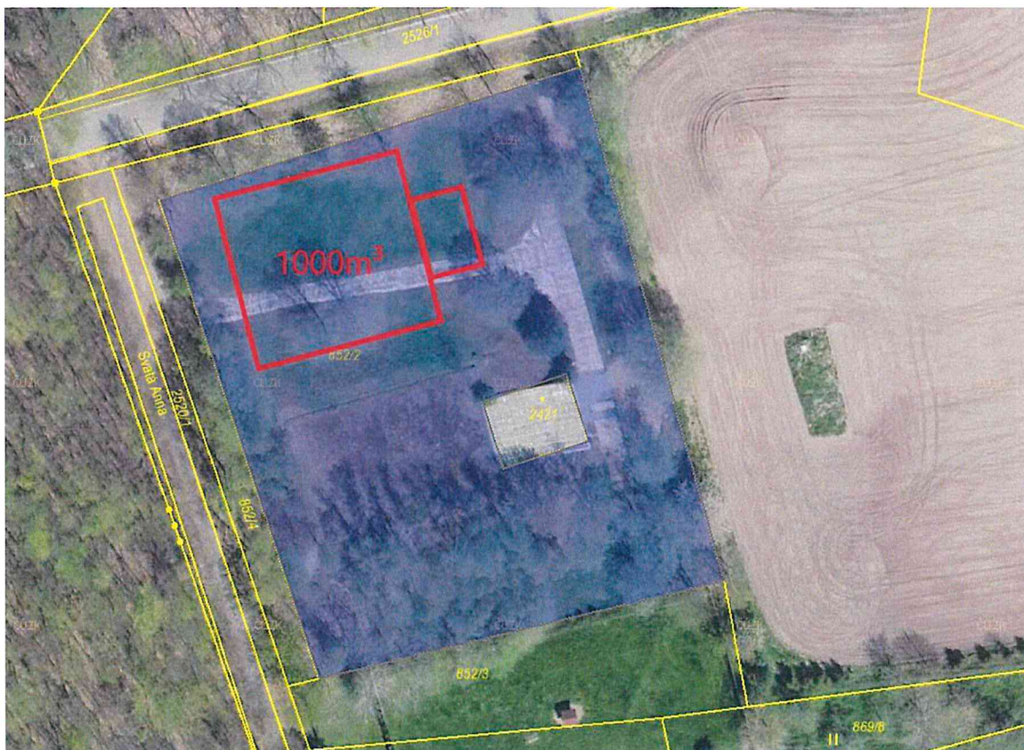
Obr. 1 Ortofoto areálu vodojemu Svatá Anna s orientačním umístěním novostavby vodojemu 1000 \text{ m}^3