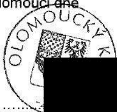
Ladislav Okleštěk hejtman kraje