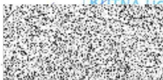
starosta Města Kutná Hora