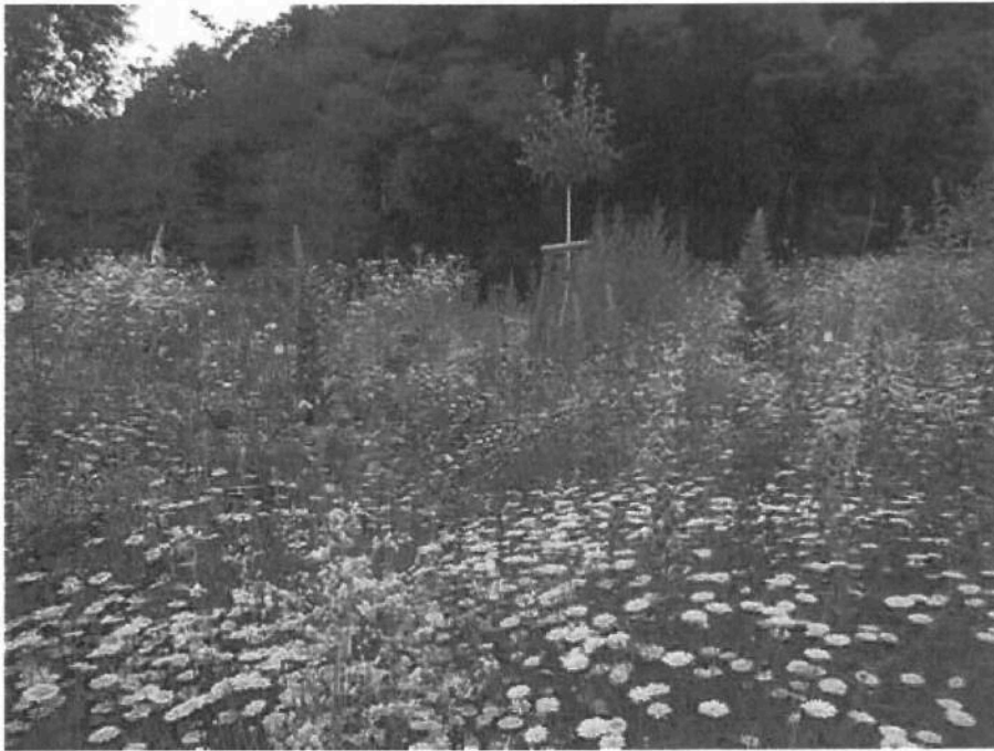
Trvalková směs – 1. rok