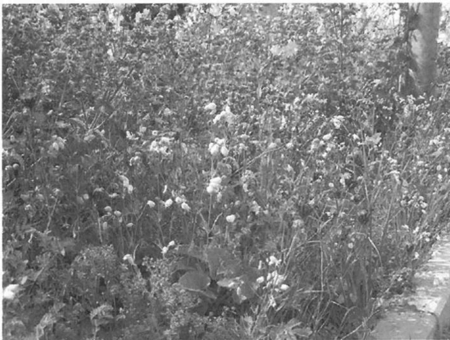
Trvalková směs – 3. rok