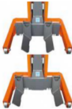
Nastavitelná zvedací vidlice