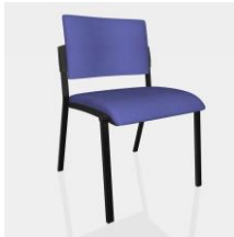
položka : č.80