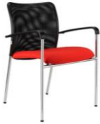
položka č. 81