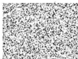
za Zhotovitele – razítko a podpis