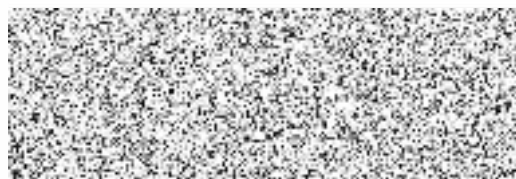
za MYPA, s.r.o.