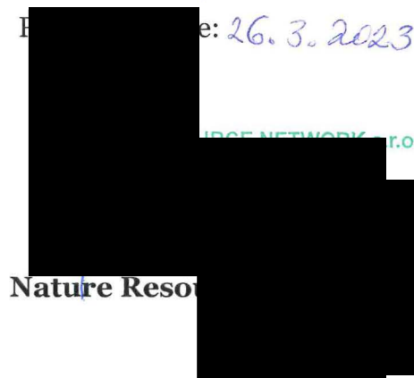
Nature Resource Network s.r.o.