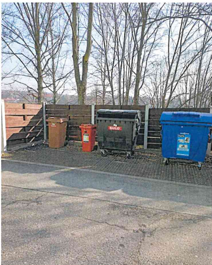
Stanoviště č. 5 – Osvoboditelů 1808