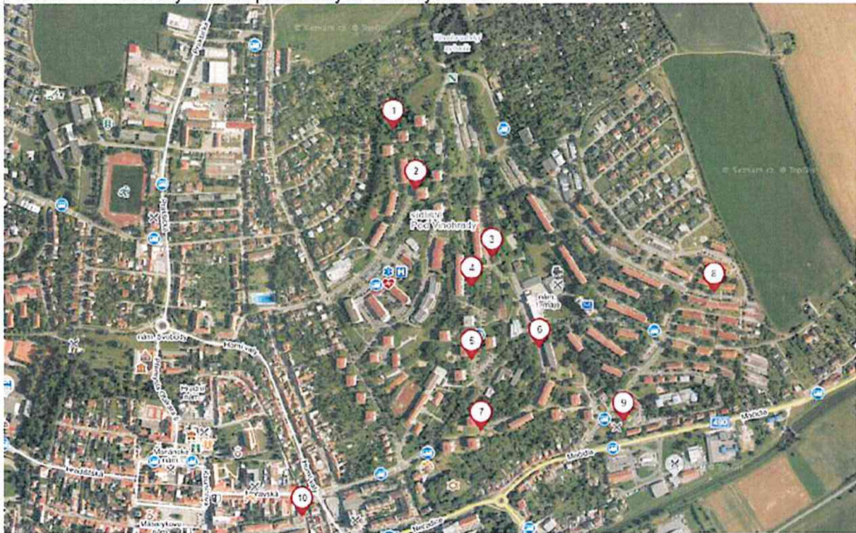
Stanoviště č. 1 – Luhanova točna 1824