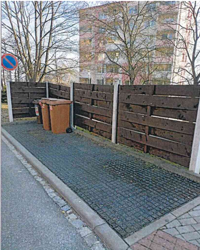
Stanoviště č. 3 – Osvoboditelů 1418