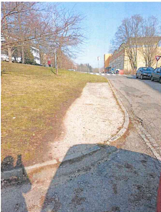
Stanoviště č. 7 – Šaripova 1802