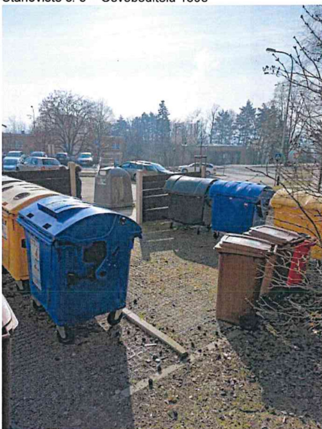
Stanoviště č. 6 – Šaripova 1806