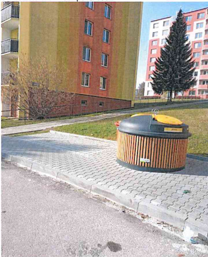
Stanoviště č. 8 – Větrná 1404