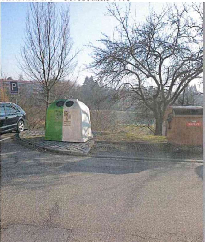
Stanoviště č. 4 – Revoluční 1812