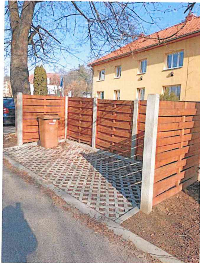
Stanoviště č. 10 – U Fortny 2159