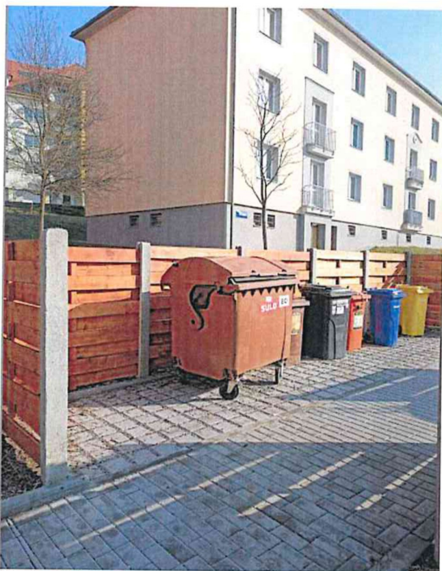
Stanoviště č. 9 – Okružní 1443