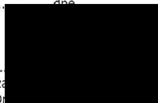
za MUDr. .... ředitel