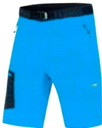
Varianta 1 – v barevném provedení ocean/anthracite