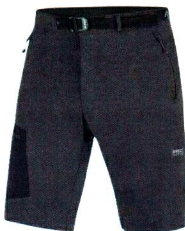
Varianta 2 – v barevném provedení anthracite/black