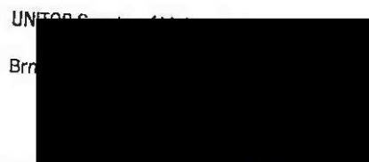
tajemník UNITOP SKP Žďár nad Sázavou, z.s.

MĚSTO ŽĎÁR NAD SÁZAVOU Žižkova 227 / 1 ŽĎÁR NAD SÁZAVOU PSČ 591 31