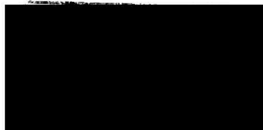
zast. Petrem Steklým ředitelem