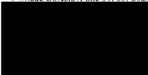
vedoucí odboru Odbor bezpečnosti a prevence kriminality Magistrát města Mladá Boleslav