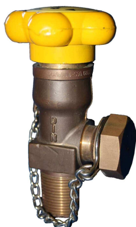
Obr. č.6 Chlorový ventil dodávaný společností GHC Invest s našroubovanou bezpečnostní těsnící maticí na přípojovacím závitě ventilu

Na přípojovacím závitě každého ventilu musí být našroubovaná a utažená závěrná, bezpečnostní těsnící matice.