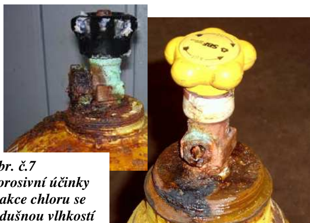
Obr. č.7 Korozivní účinky reakce chloru se vzdušnou vlhkostí

Odběratel kapalného chloru má za povinnost mít u sebe dostatečný náhradní počet těchto závěrných matic, které může použít v případě, že dojde k její ztrátě či poškození na ventilu chlorové lahve či sudu.