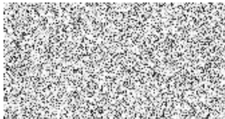
razítko a podpis odběratele

Zhotovitel potvrzuje, že byl prokazatelně seznámen s Vnitřním předpisem objednatele ZD6 „Směrnice o bezpečnosti ve ZC VUZ Velim“, které jsou dostupné na http://www.cdvoz.cz/store/ZD6_Smernice_o_bezpecnosti.pdf