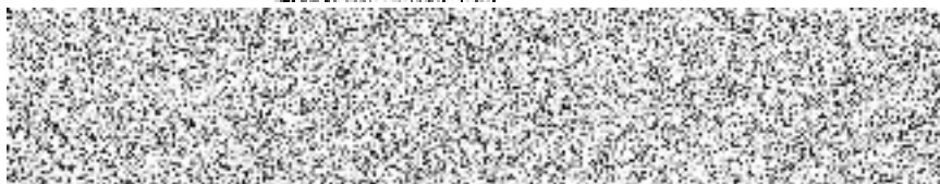
razítko a podpis dodavatele