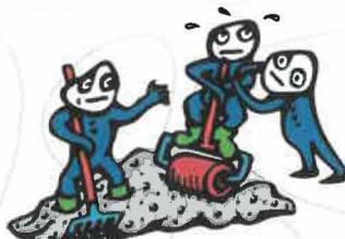
S4 - průměrně zpracovatelný beton