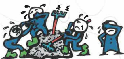
S3 - těžko zpracovatelný beton