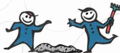
S5 - snadno zpracovatelný beton