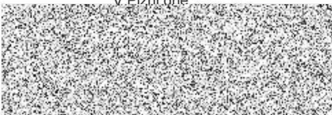
správy nemovitého majetku objednatel