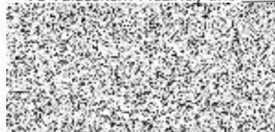
Oprávněná ČEZ Distribuce, a. s.