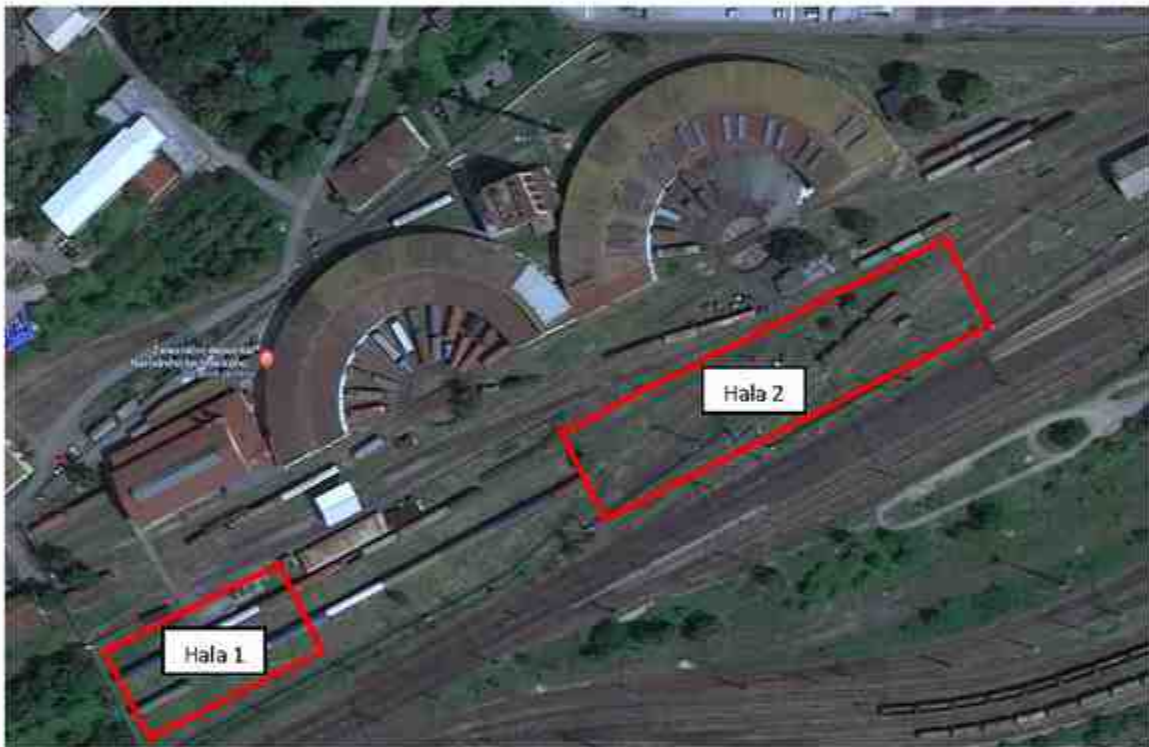
Hala č. 1 – cca 25x70m

Ceny neobsahují DPH, které bude fakturováno dle zákona o DPH v platném znění, včetně jeho dodatků.