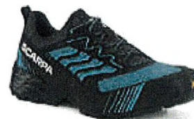
RIBELLE RUN XT GTX