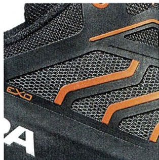
Exo Skeleton technologie