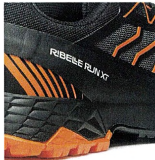
Integrovaný torzní stabilizátor

Korespondenční adresa: ALPSPORT s.r.o., Tyršova 25, 702 00 Ostrava