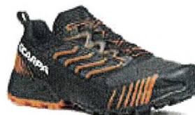
RIBELLE RUN XT