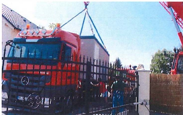
Ukázka osazení jeřábem