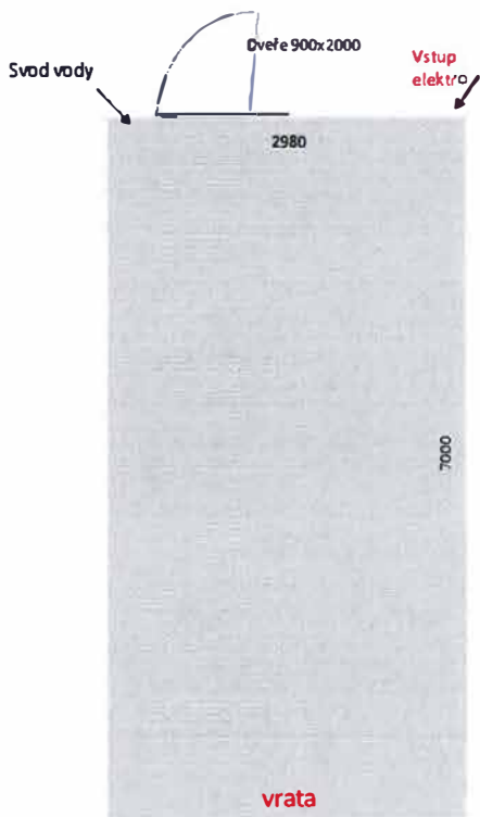
Příloha 2: Výkres garáže