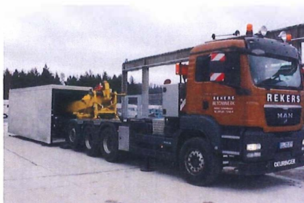
Ukázka osazení prostřednictvím speciálu „Dekenheber“

Je nutné počítat s dostatečným manipulačním prostorem potřebným pro techniku - přepravní kamlón a jeřáb.