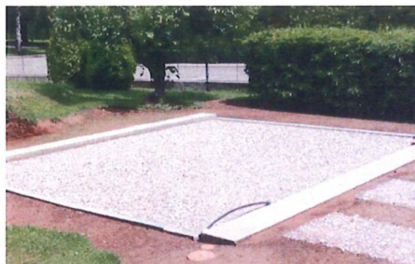
Ukázka správné přípravy pro osazení betonové dvojgaráže

Na připravené základy jsou položeny čtyři distanční podložky v rozích stavby a celá konstrukce spočívá trvale na vzduchové mezeře. Detailní informace naleznete: www.rekers.cz .