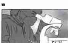
19 Dělník používá mikroskop a pracuje v kancelářské budově 21