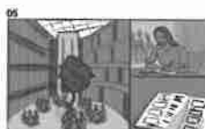
05 Dělník sedí u svého stolu a pracuje v kancelářské budově 21