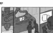
17 Dělník pracuje u svého stolu a pracuje v kancelářské budově 21