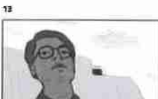
13 Dělník se dívá na kolegu a pracuje v kancelářské budově 21