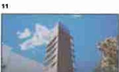
11 Vidíme moderní budovu s výhledem na město a kancelářskou budovu 21

S odvahou a podnikavostí pouštět se do nových věcí.