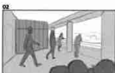
02 Na příjmu v moderní kancelářské budově 21