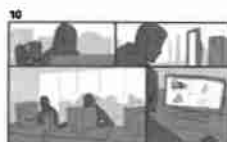
10 Dělník sedí u svého stolu a pracuje v kancelářské budově 21