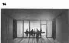
14 Dělník se dívá na kolegu a pracuje v kancelářské budově 21