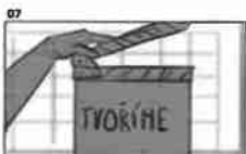
07 Dělník drží tabuli s nápisem 'TVORÍME' a pracuje v kancelářské budově 21