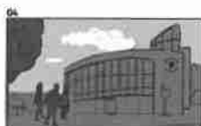
04 Dělník se dívá do strany a vidí moderní kancelářskou budovu