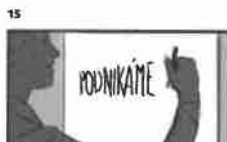
15 Dělník drží tabuli s nápisem 'PODNIKÁME' a pracuje v kancelářské budově 21