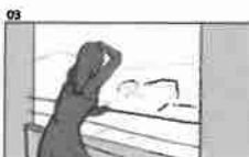
03 Dělník se dívá z okna a vidí výhled z jeho okna v kancelářské budově