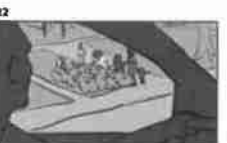
22 Dělník pracuje u svého stolu a pracuje v kancelářské budově 21