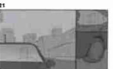
21 Dělník pracuje u svého stolu a pracuje v kancelářské budově 21

Panuje zde přesvědčení, že nemožné neexistuje.