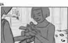
24 Dělník pracuje u svého stolu a pracuje v kancelářské budově 21