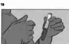
18 Dělník drží v ruce malý předmět a pracuje v kancelářské budově 21