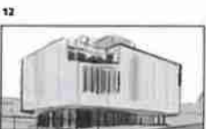
12 Dělník se dívá na moderní kancelářskou budovu 21