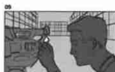
09 Dělník mluví na mobilní telefon a pracuje v kancelářské budově 21