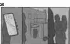
25 Dělník pracuje u svého stolu a pracuje v kancelářské budově 21

Hlas: Neobyčejná atmosféra tohoto místa je důkazem,