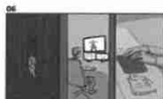
06 Dělník pracuje u svého stolu a pracuje v kancelářské budově 21