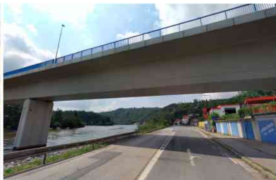
Zpracoval Pavel Špaček 1/2023