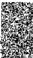
Anežka Znamenáčková členka představenstva

Ověřovací doložka pro legalizaci Podle ověřovací knihy pošty: Praha 104