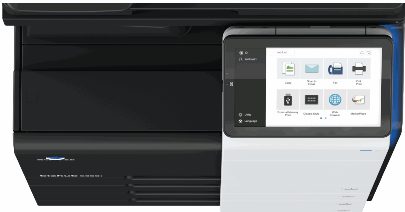
Kompletně přepracovaný panel s haptickou odezvou a ovládáním jako na mobilu nebo tabletu