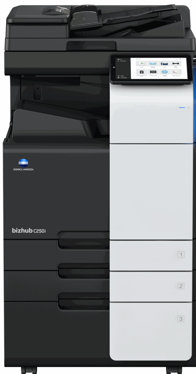
bizhub C250i s oboustranným podavačem originálů DF-632 a velkokapacitní kazetou PC-416

Zdá se vám, že u tiskárny trávíte moc času? Tak s tím je teď konec. Zbrusu nový čtyřjádrový procesor je 2x výkonnější než u předchozího modelu bizhub C258. Od zapnutí hlavního vypínače naběhne stroj až 6x rychleji. Displej reaguje bleskově bez zbytečných prodlev a všechny aplikace se spouští okamžitě. Taky nový tiskový řadič zpracovává tiskové úlohy mnohem rychleji. Takže teď toho stihnete ještě víc. A šéf vás určitě pochválí.