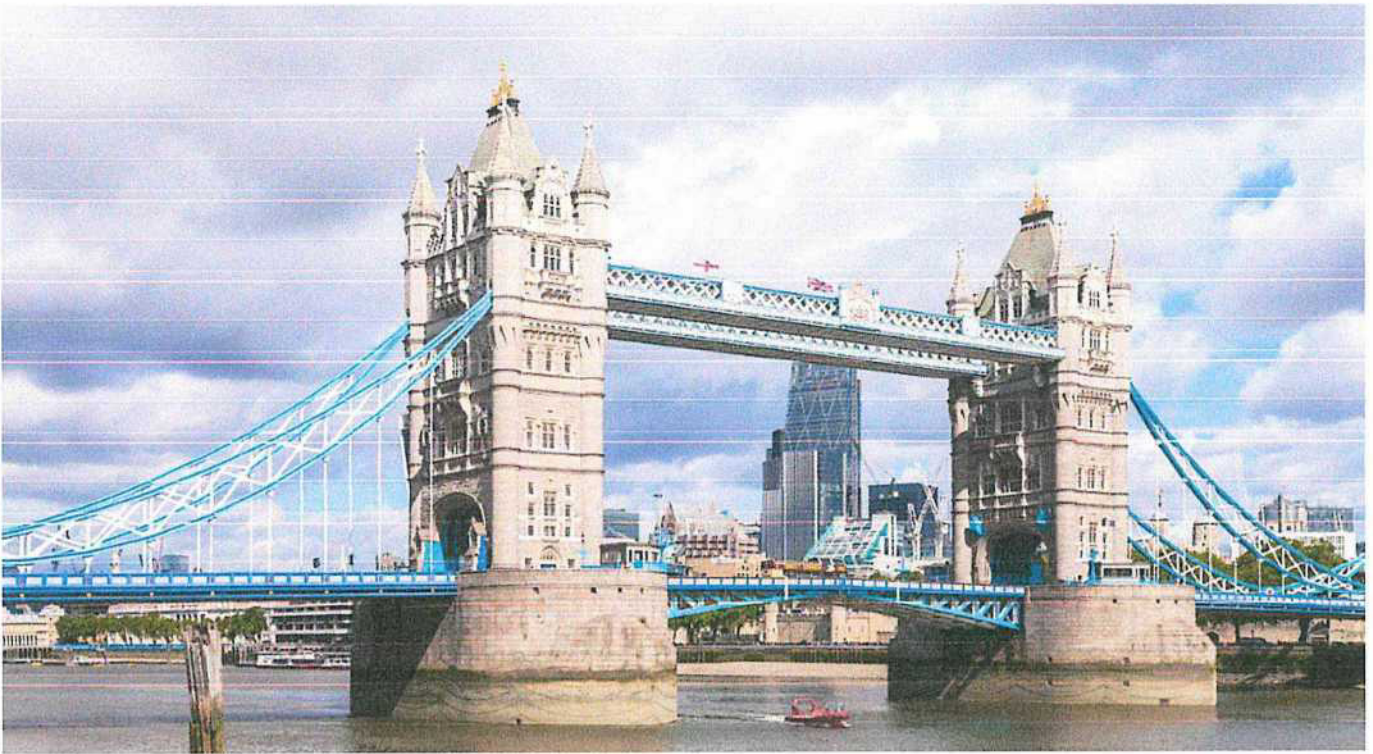
Londýn - Tower Bridge