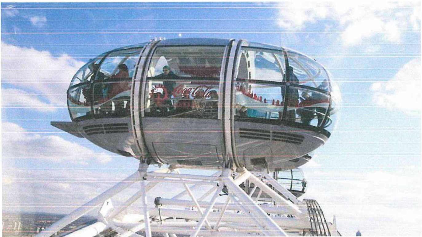
Londýn - London Eye