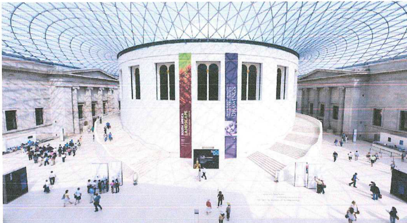
Londýn - Britské muzeum

Po 27.3. Bradavický expres z nástupiště 9 ¾ , návštěva nástupiště a obchodu se suvenýry HP poté návštěva Britského muzea - prohlídka expozic antických, syrských a orientálních archeologických památek, egyptské mumie...), poté PRIMARK pro fandy „shoppingu“.... poté odjezd vyhlídkovou lodí po Temži přes centrum Londýna kolem Toweru a Tower Bridge , vyhlídka na moderní zrekonstruované oblasti " Docklands ", město 21. století, večer - odjezd do přístavu, cesta zpět do Evropy