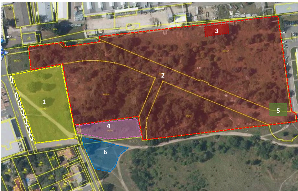
Obr. 2 Schematické znázornění ploch určených ke kosení