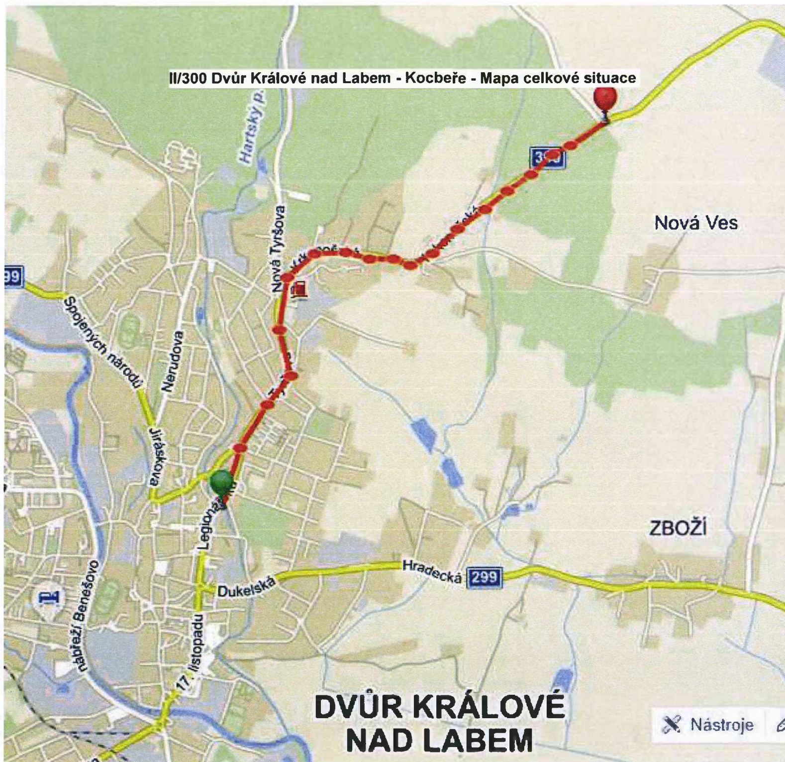
II/300 Dvůr Králové nad Labem - Kocbeře - Mapa celkové situace