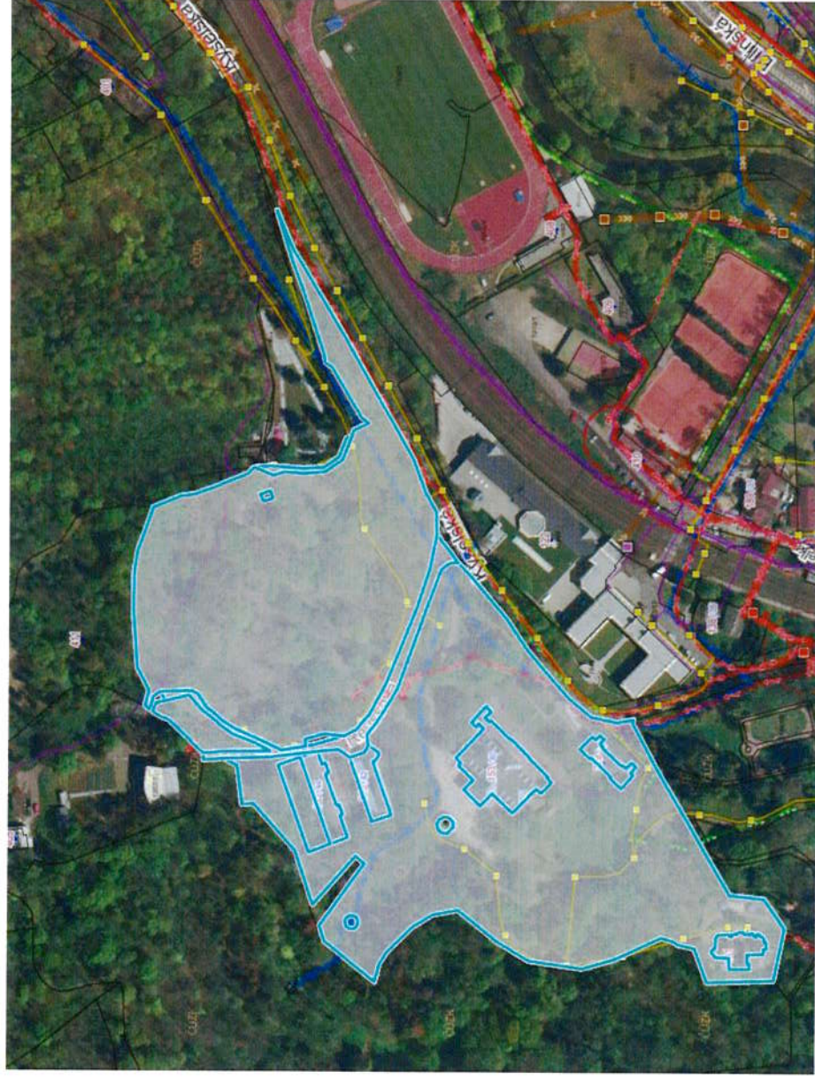
Příloha č. 1 – Areál Kyselka