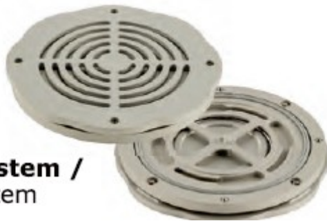
Ventil System / Valve System