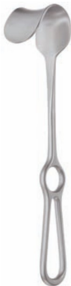
25,5 cm – 10" Fritsch