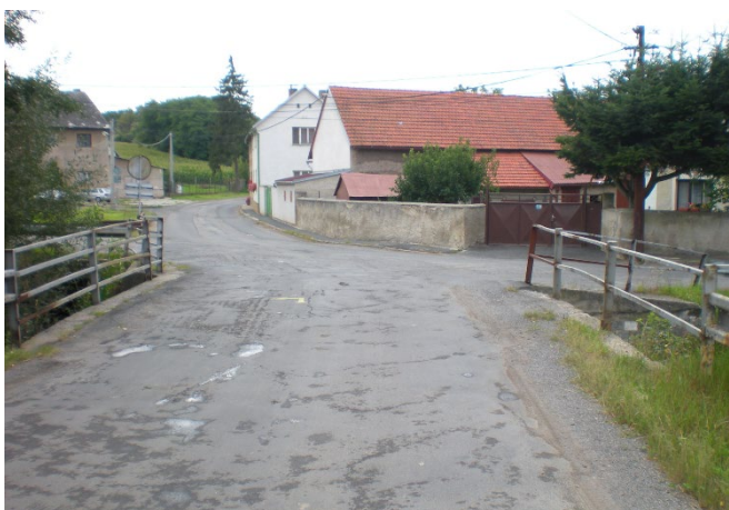
Pohled z mostu na křižovatku