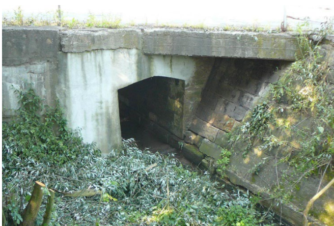
Propustek a opěrná zeď u mostu