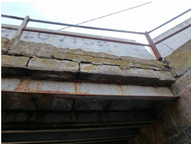
Pohled na římsu zleva.