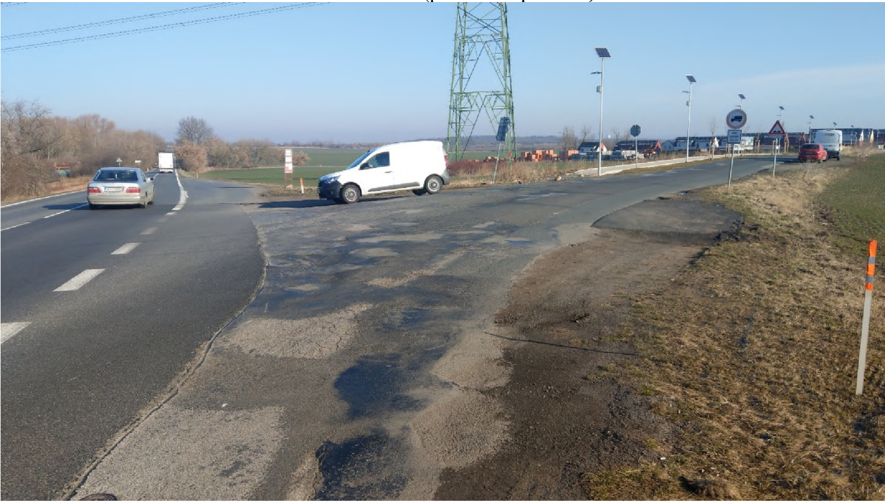
Začátek úseku (pracovní spára I/9)