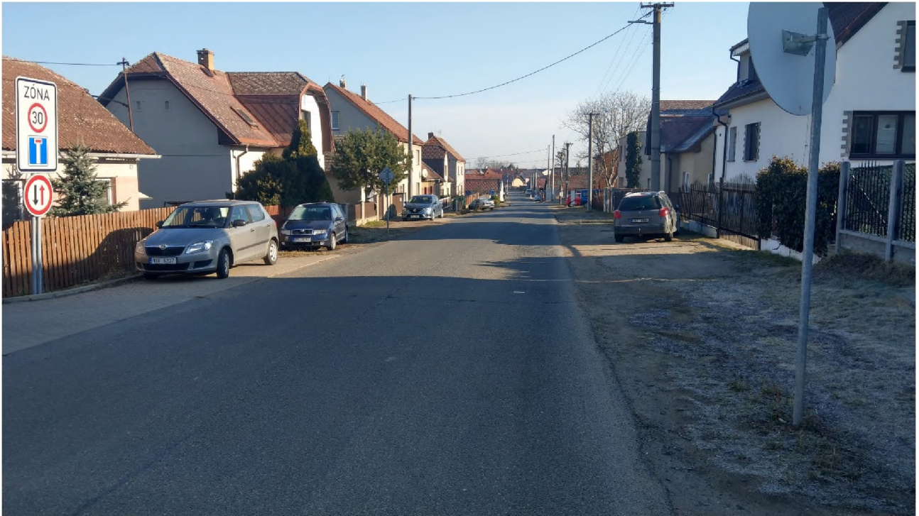
Konec úseku (pracovní spára před železničním přejezdem)