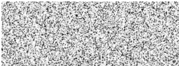
Jednatelka společnosti EXPOmedia s.r.o.