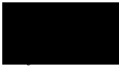
jednatel společnosti Nortech s.r.o.