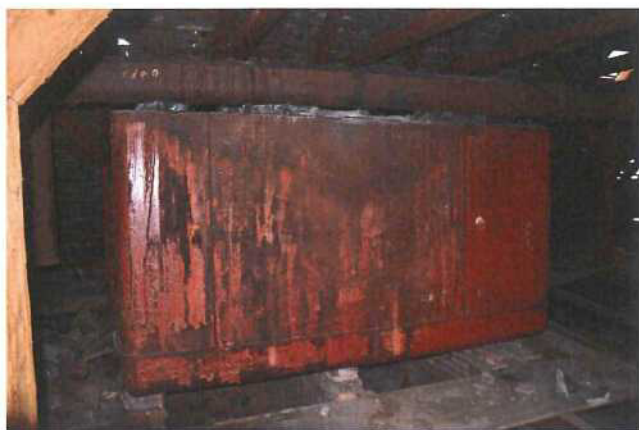
Obr. 4: Kád' 1 s dopravníkem

Železná kvádrotvá, zeshora uzavřená dutá konstrukce, rozměry: 2,7x3,5m, výška 2,2m. Kád' je podložena cihelných pilířích usazena na zděných klenbách. V místě vyříznuty vazné trámy a záklop.