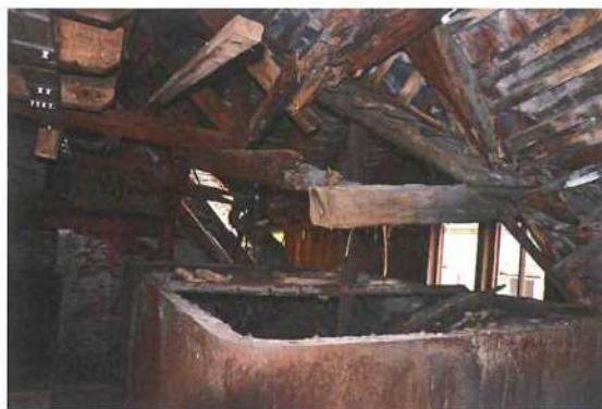
Obr. 5 a 6: Kád' 2