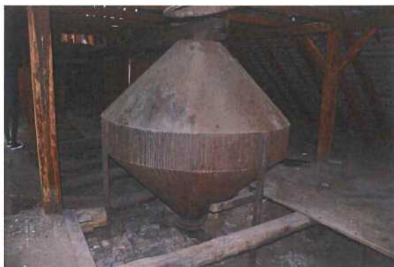
Obr. 2 a 3: Násypka s dopravníkem