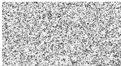
jednatel společnosti podepsáno elektronicky